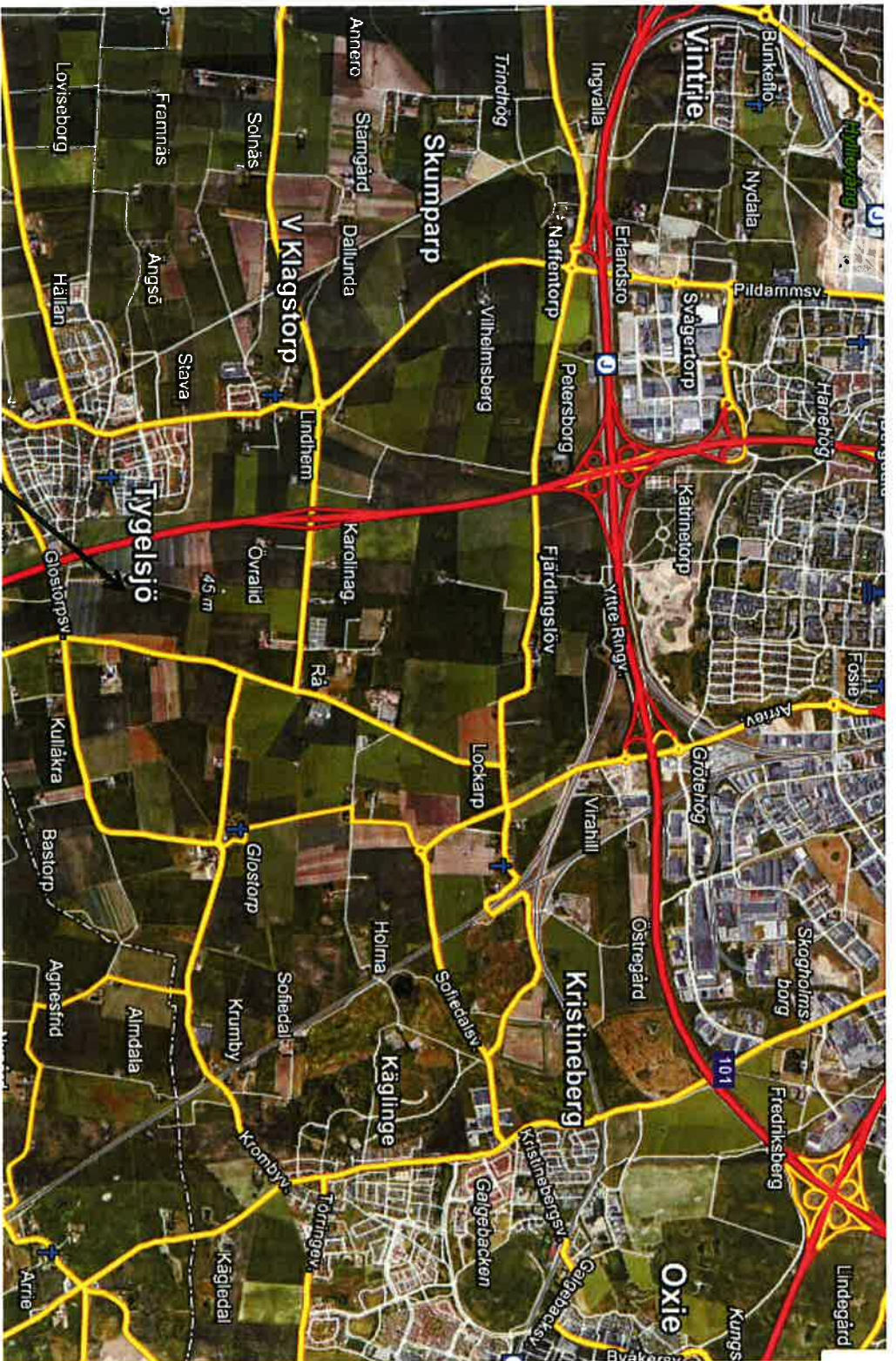
07BN07, Plan: R7-0116, F-nr: 332/16.